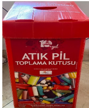
Atık pil kutusu

Tesisimizin belirli noktalarına koyduğumuz atık pil toplama kutuları sayesinde, atık pillerin çevreye vereceği zararı engelliyor ve atık pillerimizi belediyeye teslim ediyoruz.