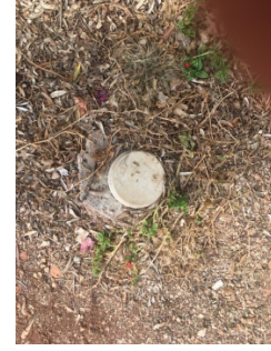
Atık su bertaraf kanalı