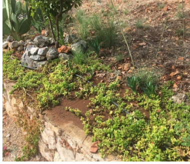
damlama sistemi sulama