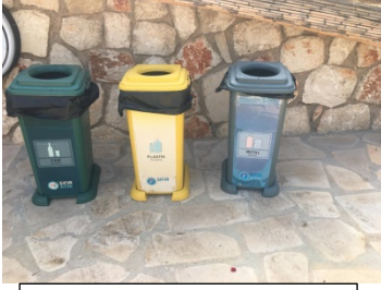
Geri dönüşüm kovaları